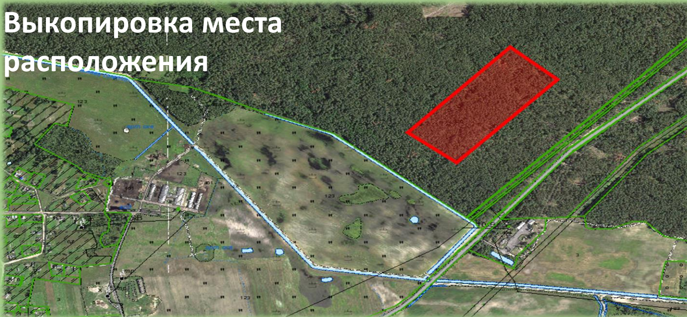
Схема места расположения