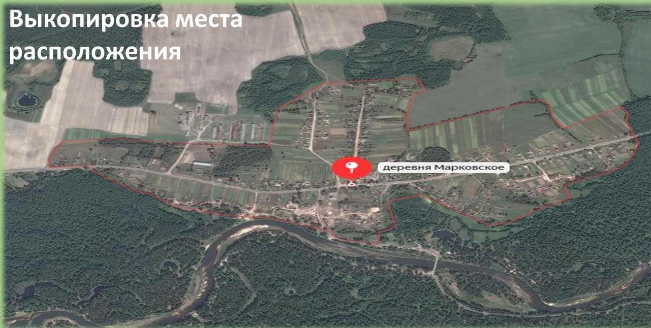
Схема места расположения