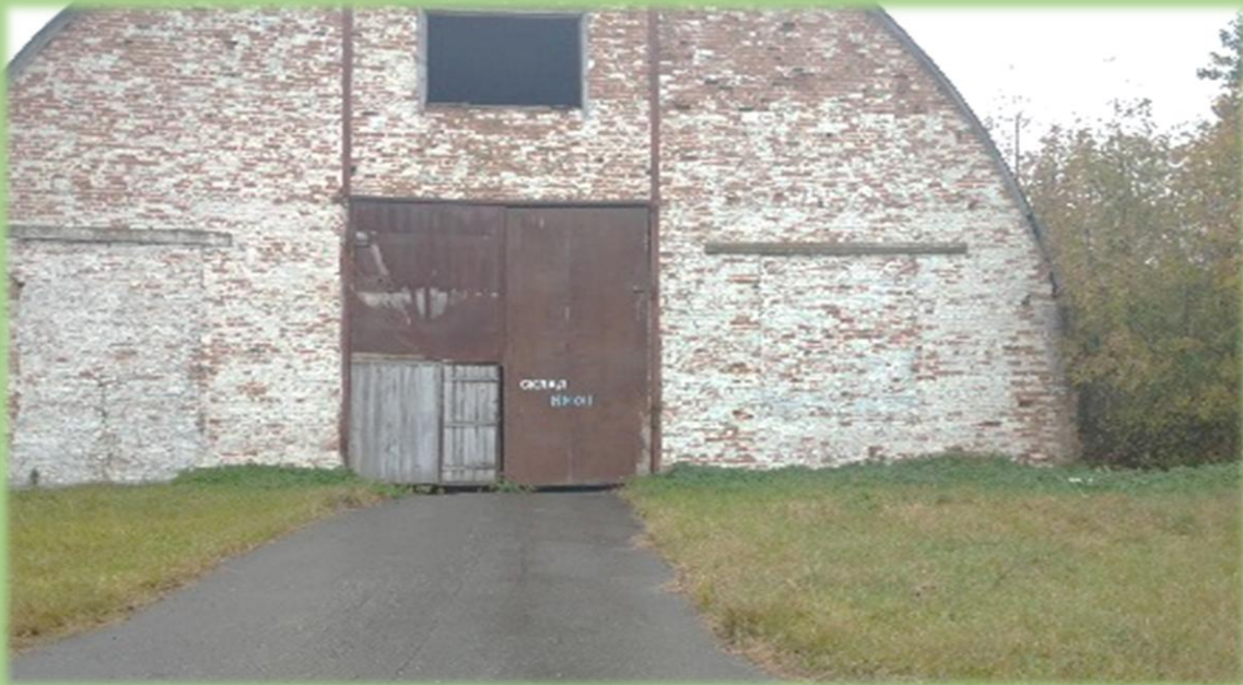
Фото объектов недвижимости