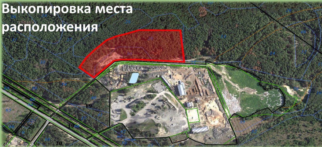
Схема места расположения