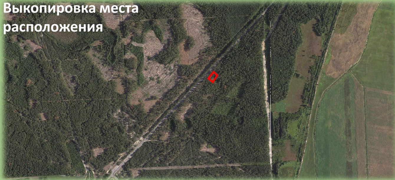
Схема места расположения